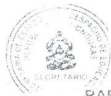
Rafael Pineda Ponce RAFAEL PINEDA PONCE Secretario de Estado Despacho de Educación

En fe de lo cual firman el presente convenio en dos ejemplares originales y de un mismo contenido, en la ciudad de Tegucigalpa. Municipio del Distrito Central a los cuatro días del mes de julio de dos mil seis.