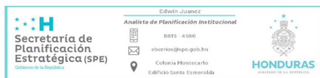
Figura 1: Convocatoria por parte de la Secretaría de Planificación Estratégica (SPE), para la socialización del Plan Estratégico Institucional.

Agradeciendo de antemano su fina atención, reiteramos las muestras de nuestra más alta y distinguida consideración